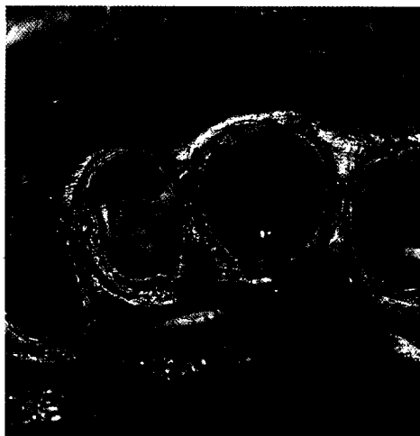
Qualitätsmanagement zwischen Zahnarztpraxis und Dentallabor Seite 315