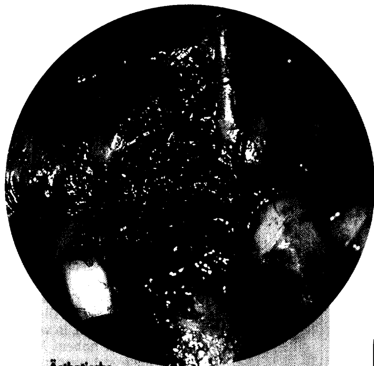
Ästhetische perioprothetische Frontzahnrekonstruktionen Seite 301