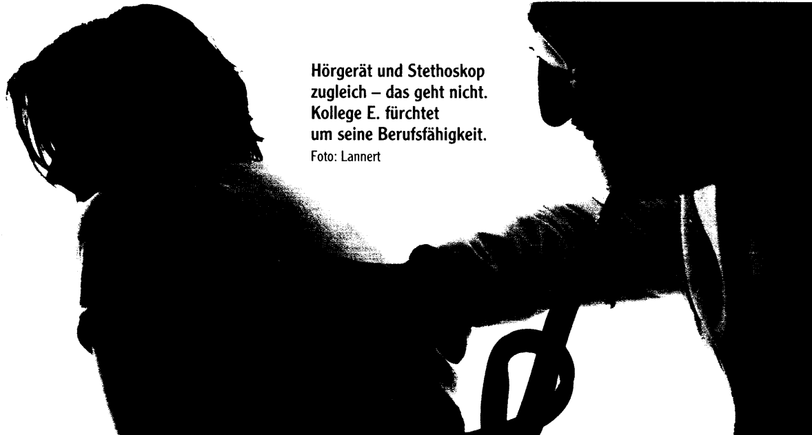
Hörgerät und Stethoskop zugleich – das geht nicht. Kollege E. fürchtet um seine Berufsfähigkeit.

DRESDEN (nd) – Einen heißen Herbst prophezeien führende Ärztefunktionäre. Grund: Die Mediziner denken über deutschlandweite Protestaktionen nach. Sachsens Ärzte haben bereits ganz konkrete Pläne für den September. AP fragte die Kollegen, warum sie ihre Praxis für eine Woche schließen wollen ▶ 13