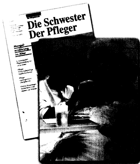
Titelbild: Mangelernährung alter Patienten ist keine Seltenheit in deutschen Pflegeeinrichtungen. Entweder es wird seitens des Pflegepersonals zu wenig aufgegeben, ob die alten Menschen essen, oder das Essen entspricht nicht dem Bedarf der Senioren. Die Autorin erläutert ab Seite 660 die pflegerischen Maßnahmen bei Mangelernährung.

Schmitt/Hofmann/Medikamenten-Applikation: Bei vielen Medikamenten ist die Applikationsform sehr erklärungsbedürftig – so auch bei der Augenarznei. Der abschließende Beitrag von Sabine Schmitt und Carsten Hofmann liefert praktische Tipps und beendet zugleich unsere Artikelserie (ab Seite 646).