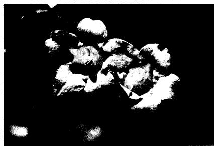
Titelfoto: Gelsemium sempervirens (Gift-Jasmin/Wilder Jasmin; arzneilich verwendet nur in homöopathischen Dosierungen ) von Margot Spohn