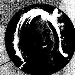
Ich liebe, was ich tue – Ich liebe, wo ich bin – und ich liebe, mit wem ich bin.