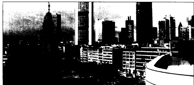
Implantologie der Zukunft – Rückblick auf die 5. Frankfurter Implantologie Tage Seite 46