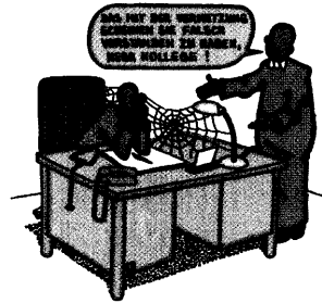
Serie Arzt im Netz (Teil 1) Wofür Ärztenetze gut sind – Anforderungen und Chancen