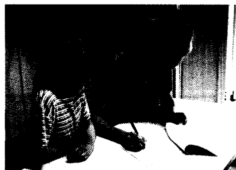
Meinungsumfrage von Eltern zur Kariesprophylaxe Seite 160