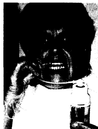
Gingivjet-Gerät . Seite 137