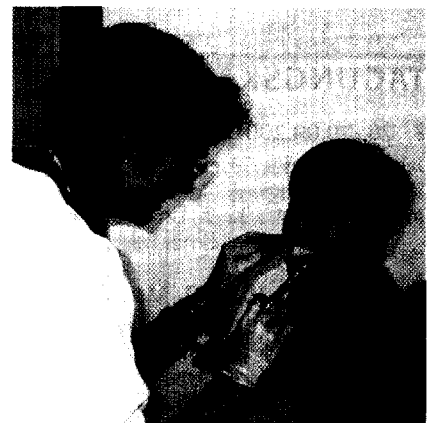
Fluoridlackprogramm in Hamburg Seite 125