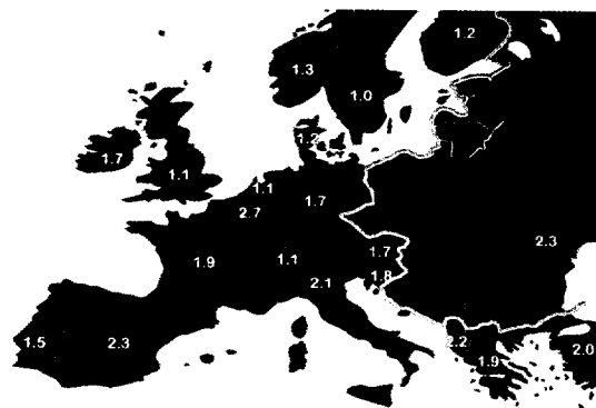
DMFT-Daten für 12-Jährige in Europa Seite 66