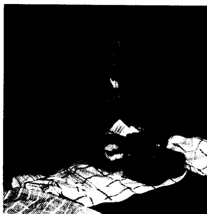
Bedeutung der Pausenverpflegung für die Zahngesundheit Seite 83