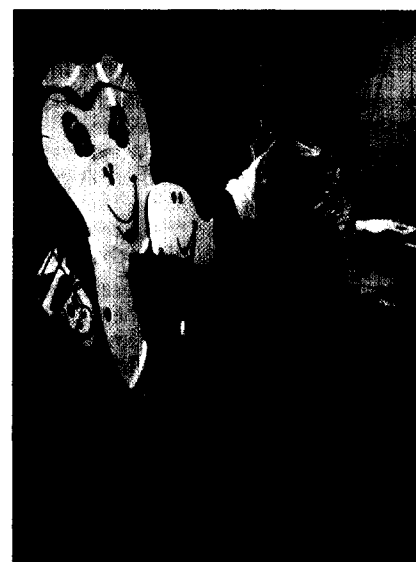
Spielend erlernen Kinder die Grundlagen der Mundhygiene Seite 48