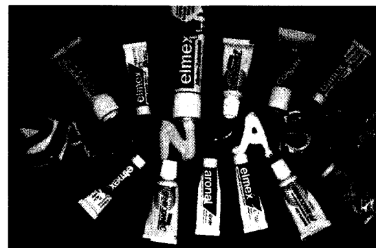
Lokale Fluoridierungsmaßnahmen in Form fluoridhaltiger Zahnpasten Seite 17