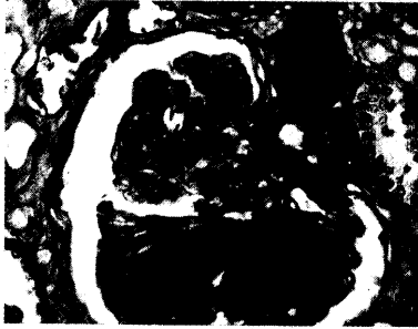
Abb.: Urban & Schwarzenberg

Drei Studien mit Meilenstein-Charakter machen den Diabetologen in diesen Tagen neuen Mut: Sartane können mithelfen, die gefürchteten Nierenschäden bei Typ 2 Diabetikern aufzuhalten. Einzelheiten zu PRIME, RENAAL und MARVAL in unserem aktuellen Kongressbericht aus San Francisco.