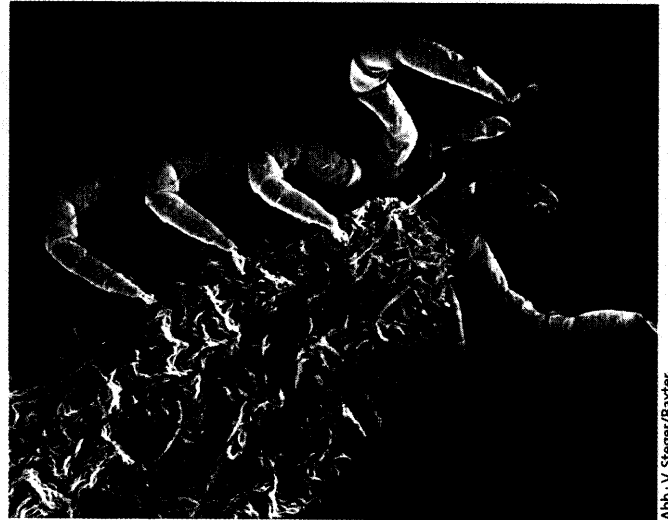
Abb.: V. Steger/Baxter