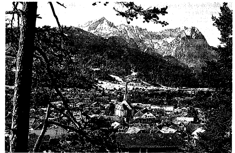
Garmisch-Partenkirchen, meist besuchter Fremdenverkehrsort im deutschen Alpengebiet.

bereits zum dritten Mal statt. Das Konzept basiert auf drei Entscheidungen: Die Veranstaltung ist interdisziplinär, wir verstehen sie als Seminarkongress, und die Hauptsitzungen werden von Tutorien und Kursen begleitet. Wir haben Experten der Intensivmedizin aus verschiedenen Disziplinen zu bedeutungsvollen Themen eingeladen und daraus das Gesamtprogramm geformt. Der Anspruch als Seminarkongress betont die angestrebte inter-