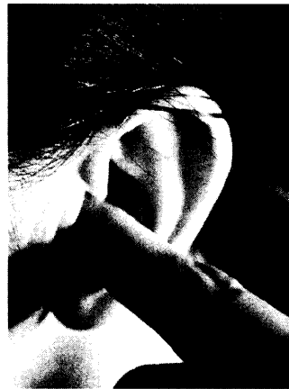
Abb.: Volker Derlath