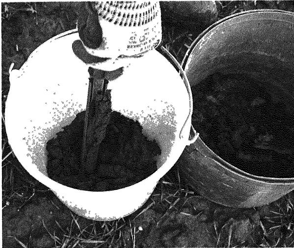
Was leisten alternative Bodenanalysen und darauf aufbauende Düngeempfehlungen? 54