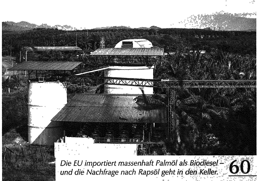
Die EU importiert massenhaft Palmöl als Biodiesel – und die Nachfrage nach Rapsöl geht in den Keller. 60