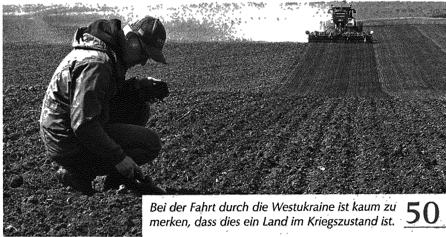
Bei der Fahrt durch die Westukraine ist kaum zu merken, dass dies ein Land im Kriegszustand ist. 50