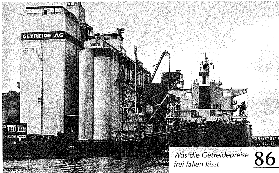
Was die Getreidepreise frei fallen lässt. 86