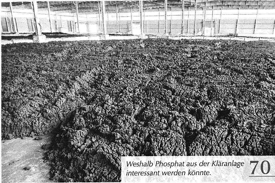
Weshalb Phosphat aus der Kläranlage interessant werden könnte. 70