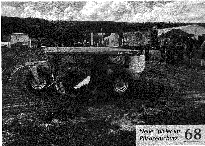
Neue Spieler im Pflanzenschutz. 68