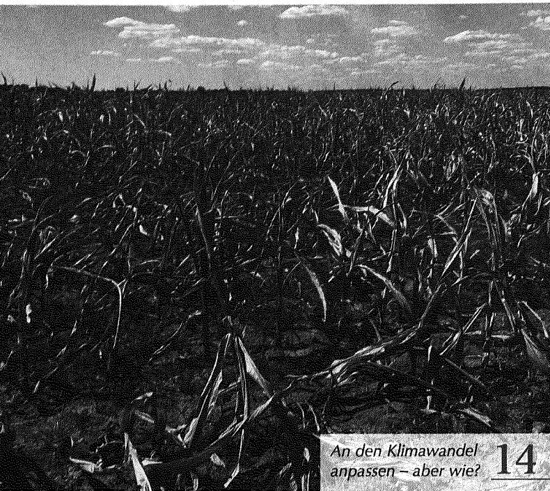
An den Klimawandel anpassen – aber wie? 14