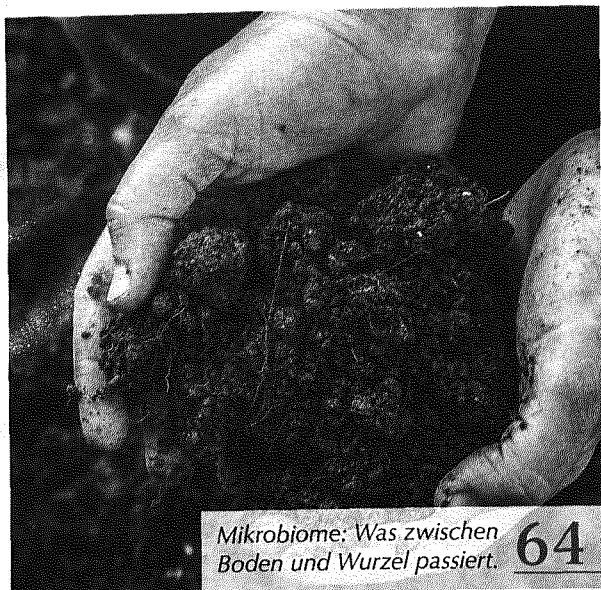
Mikrobiome: Was zwischen Boden und Wurzel passiert. 64