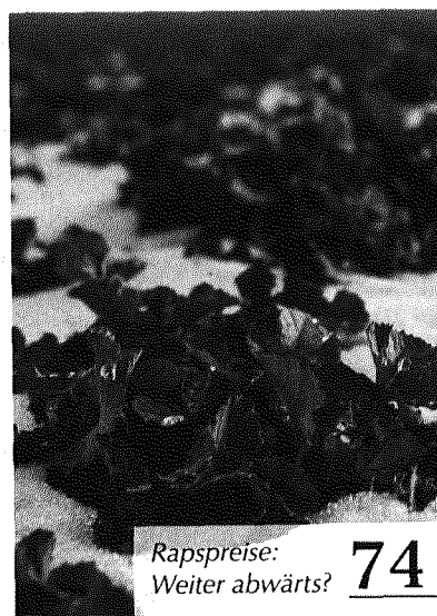
Rapspreise: Weiter abwärts? 74