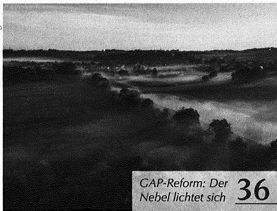
GAP-Reform: Der Nebel lichtet sich 36