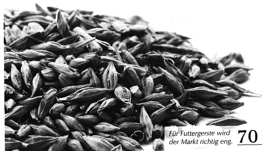
Für Futtergerste wird der Markt richtig eng. 70