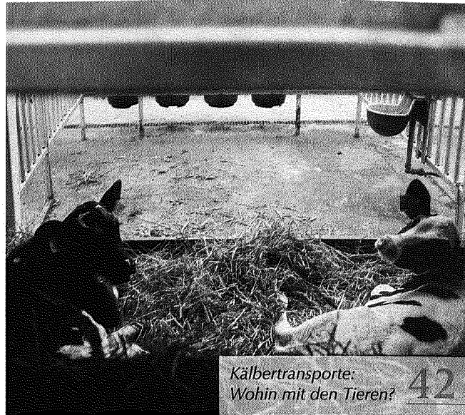
Kälbertransporte: Wohin mit den Tieren? 42