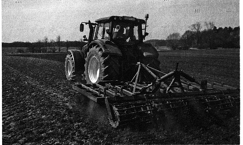
Mechanische Aufwuchskontrolle nicht ohne Nebenwirkungen. 60