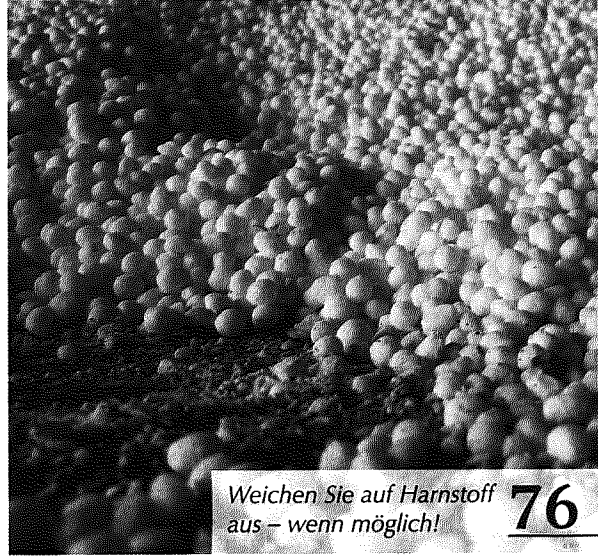
Weichen Sie auf Harnstoff aus – wenn möglich! 76