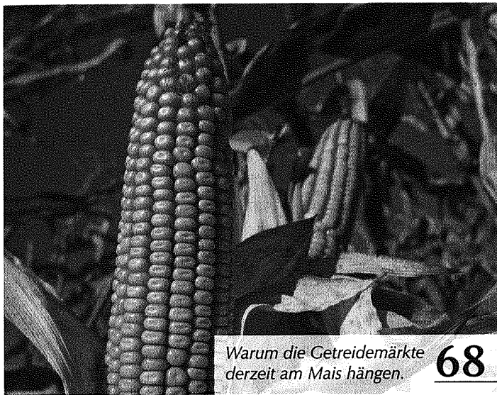
Warum die Getreidemärkte derzeit am Mais hängen. 68