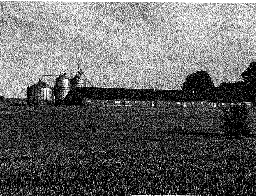
Dänemark: Strukturwandel, Skepsis und Resignation. 14