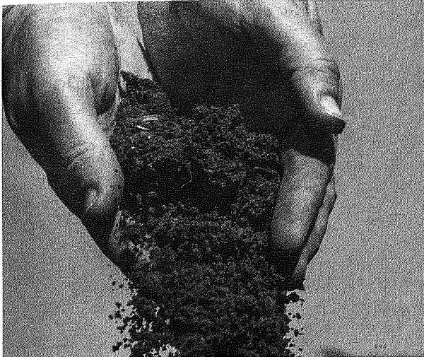
Klimazertifizierung zwischen Chance und Betrug. 54