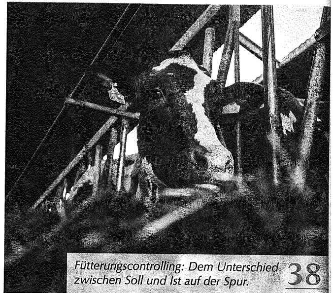
Fütterungscontrolling: Dem Unterschied zwischen Soll und Ist auf der Spur. 38