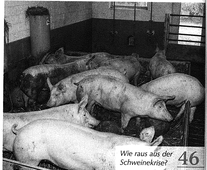
Wie raus aus der Schweinekrise? 46