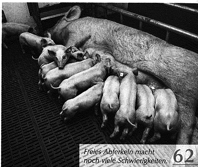
Freies Abferkeln macht noch viele Schwierigkeiten. 62