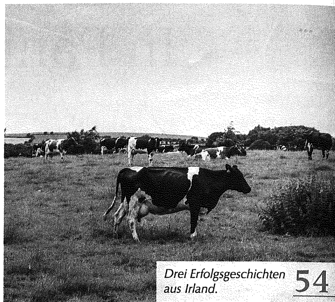
Drei Erfolgsgeschichten aus Irland. 54