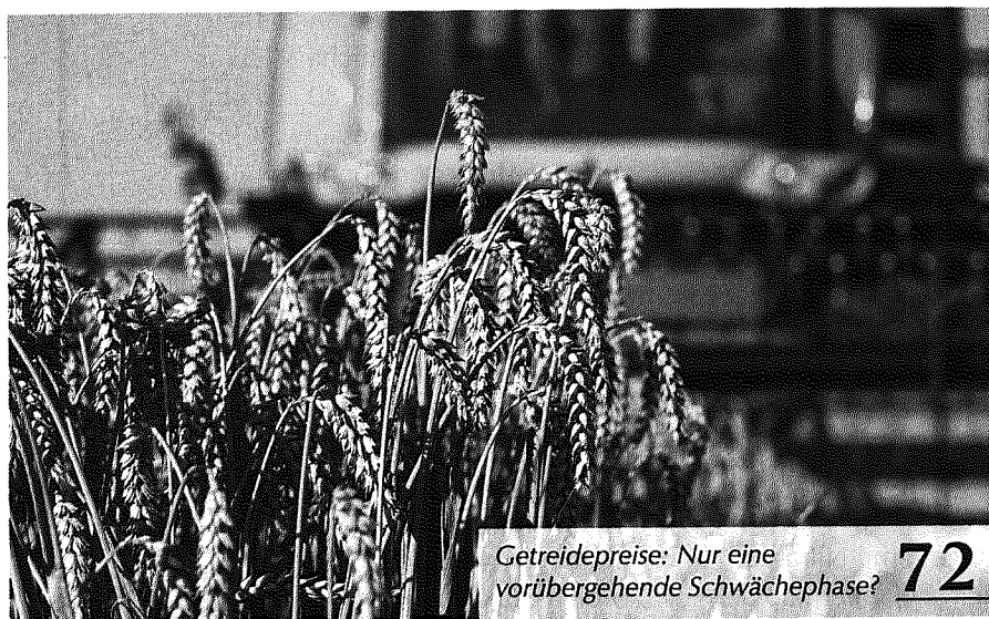
Getreidepreise: Nur eine vorübergehende Schwächephase?