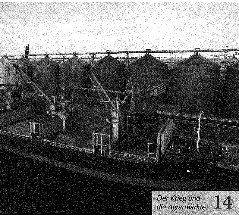
Der Krieg und die Agrarmärkte. 14