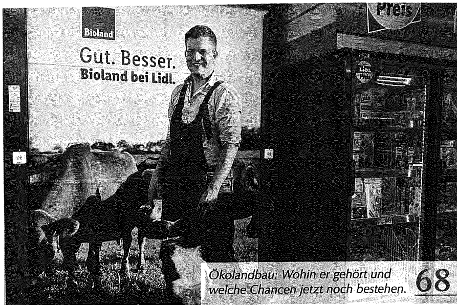
Ökolandbau: Wohin er gehört und welche Chancen jetzt noch bestehen.