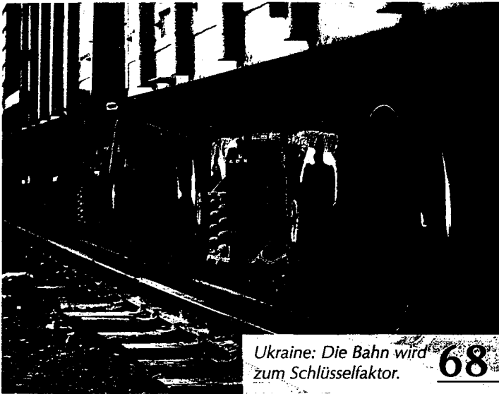
Ukraine: Die Bahn wird zum Schlüsselfaktor. 68