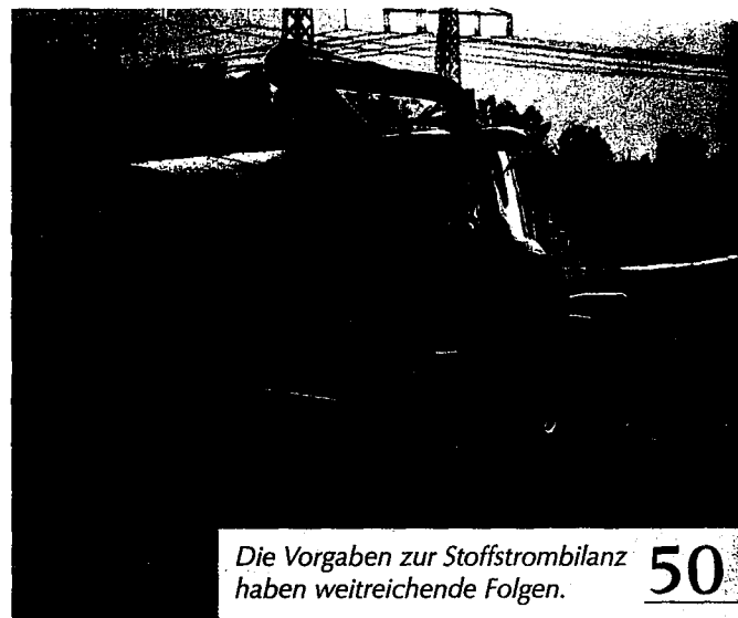
Die Vorgaben zur Stoffstrombilanz haben weitreichende Folgen. 50