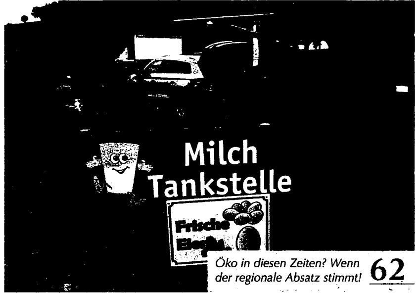
Öko in diesen Zeiten? Wenn der regionale Absatz stimmt! 62