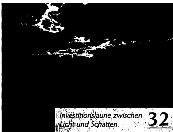
Investitionslaune zwischen Licht und Schatten. 32