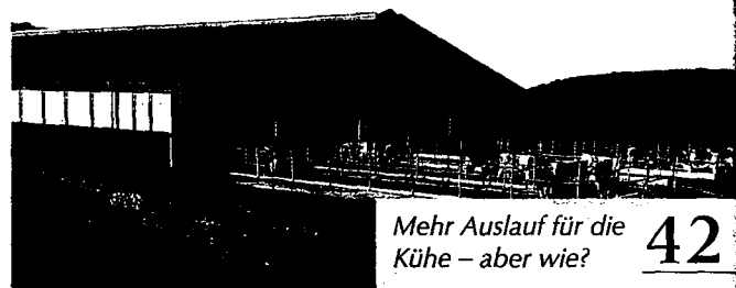
Mehr Auslauf für die Kühe – aber wie? 42