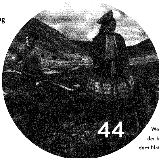
Welche Beziehung gibt es zwischen der biodynamischen Landwirtschaft und dem Naturverständnis indigener Völker?

In den Beiträgen ist u. a. von Bauern, Köchen, Bäckern, Mitgliedern, Verbrauchern die Rede. Damit sind Menschen jeden Geschlechts gemeint.