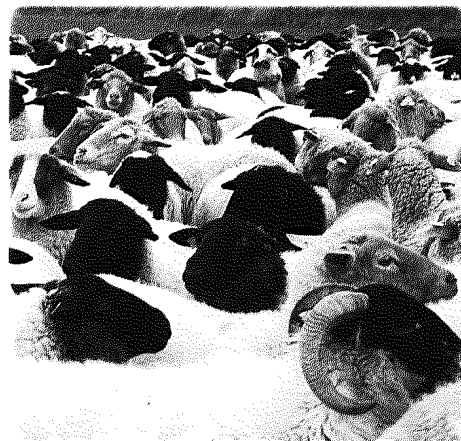
Besichtigung der Schafherde mit reinrassigen Rhön- und Fuchsschafen und ihren Kreuzungslämmern von Burkhard Ernst im Werra-Meißnerkreis anlässlich der GEH-Jahrestagung in Witzenhausen 2019