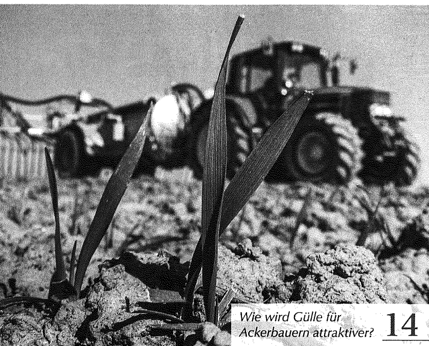
Wie wird Gülle für Ackerbauern attraktiver? 14