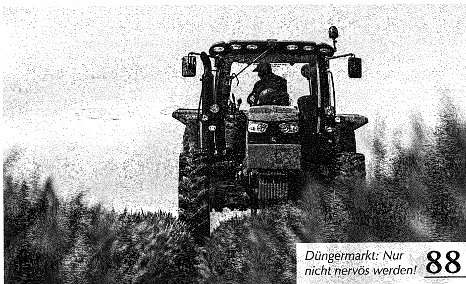
Düngermarkt: Nur nicht nervös werden! 88