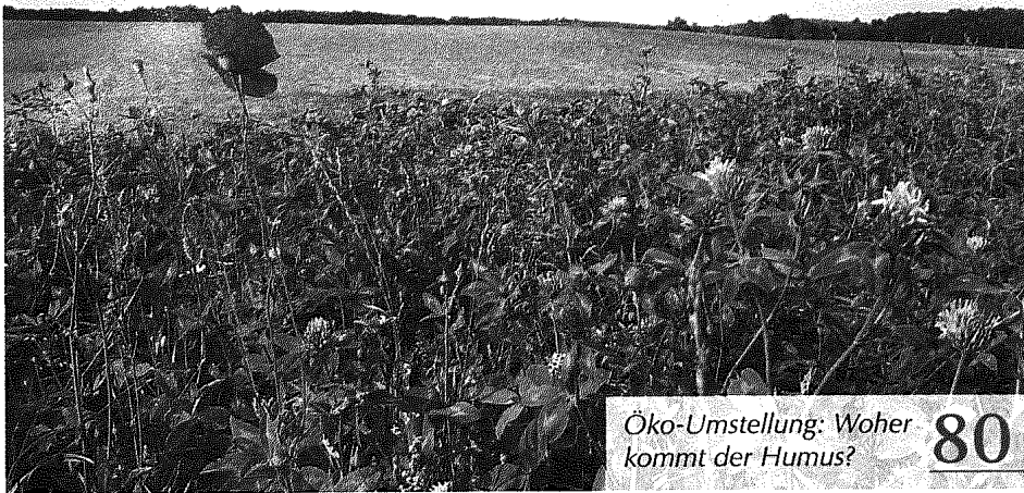
Öko-Umstellung: Woher kommt der Humus? 80