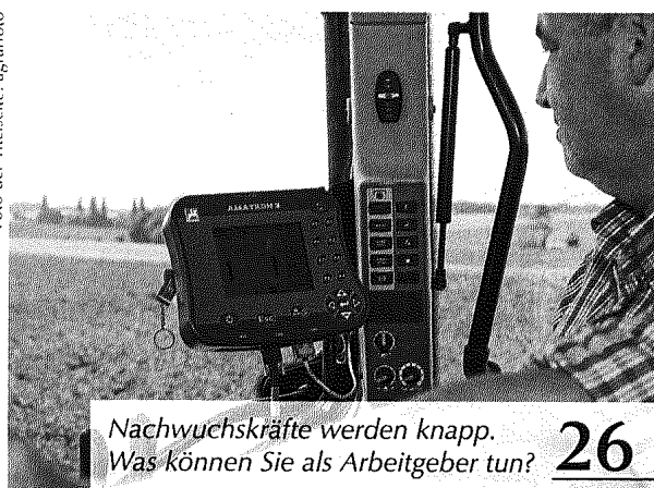
Nachwuchskräfte werden knapp. Was können Sie als Arbeitgeber tun? 26