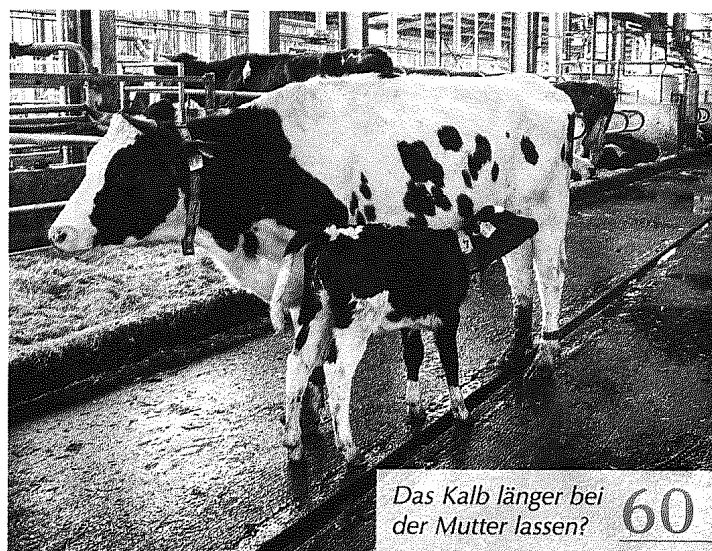
Das Kalb länger bei der Mutter lassen? 60