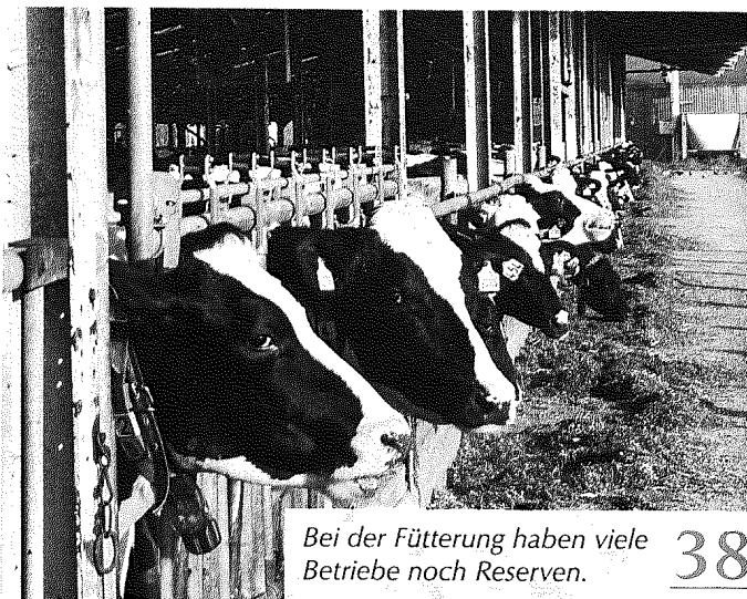
Bei der Fütterung haben viele Betriebe noch Reserven. 38