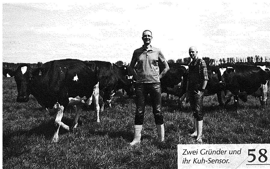
Zwei Gründer und ihr Kuh-Sensor. 58