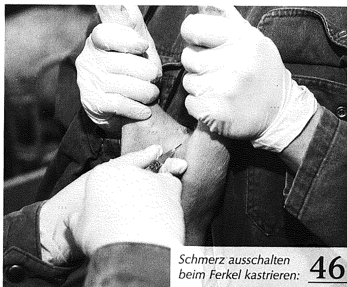
Schmerz ausschalten beim Ferkel kastrieren: 46