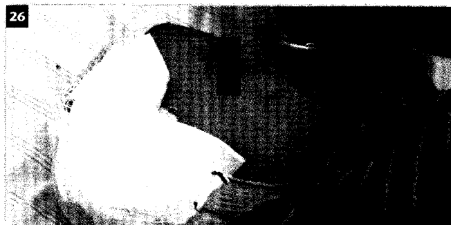
Dass Krankenhausmitarbeiter sehr leicht an Masern erkranken können, zeigt eine kürzlich publizierte Fallserie aus einem hessischen Bezirkskrankenhaus.