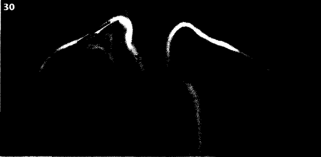
30 Die Arteria lusoria verläuft hauptsächlich retroösophageal und hat eine leichte Prädominanz beim weiblichen Geschlecht. Die Inzidenz ist höher bei Trisomie 21.