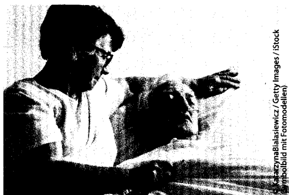
Fotobild mit Fotomodellen