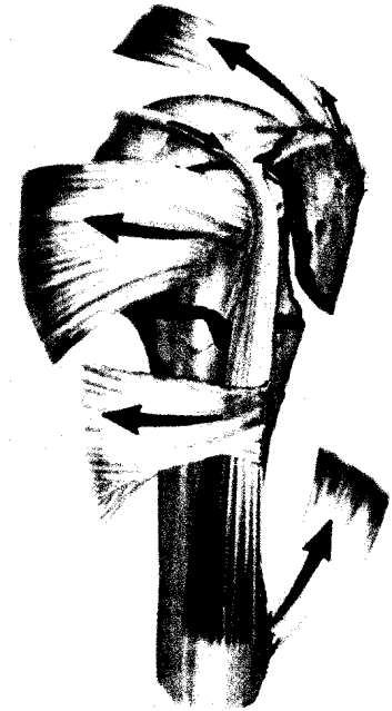
Dislokationsvektoren der proximalen Humerusfraktur am Beispiel einer 4-Segment-Fraktur. Lesen Sie mehr auf ► S. 83