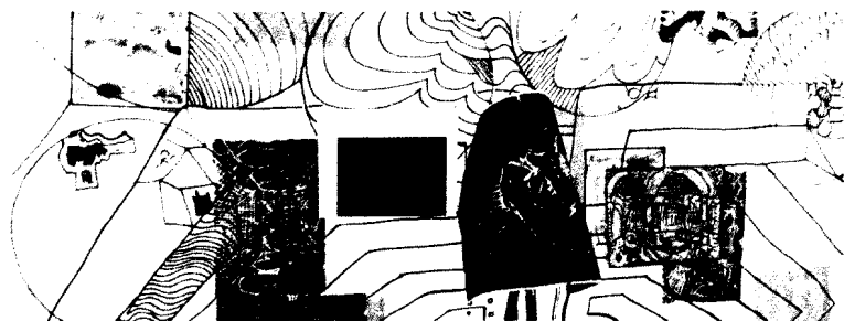
Titelbild (Ausschnitt): „Plan B“ von Nele Ströbel Lesen Sie mehr in der „Galerie“ auf Seite 64.