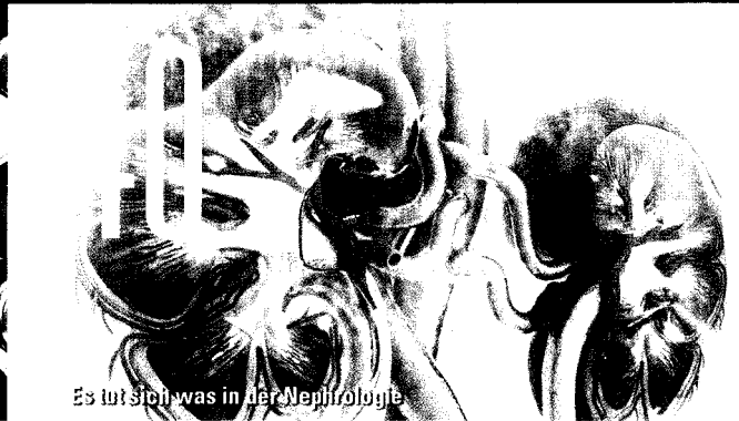
Es tut sich was in der Nephrologie