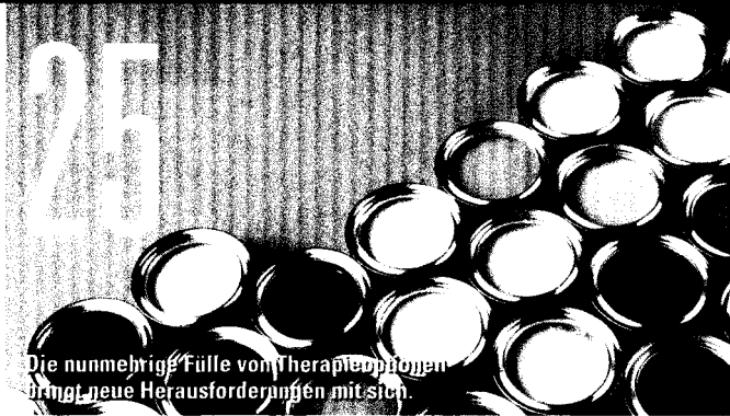
Die nunmehrige Fülle von Therapieoptionen bringt neue Herausforderungen mit sich.