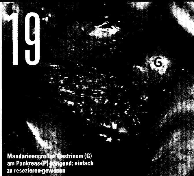
Mandarinengroßes Gastrinom (G) am Pankreas (P) hängend; einfach zu resektieren gewesen