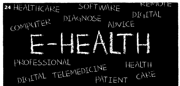
Die Begriffe E-Health, Big Data und künstliche Intelligenz sind in der Medizin keine Unbekannten mehr. Mit diesen Themen beschäftigt sich der Beitrag „Zukunftsvision oder Realität?“