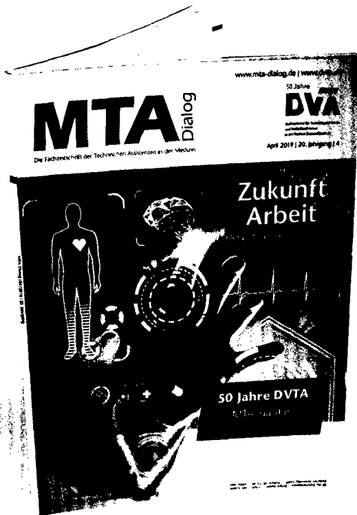
Diese Ausgabe beschäftigt sich mit der „Zukunft Arbeit“. Dabei geht es unter anderem um neue Technologien und den Umgang mit zunehmenden Arbeitsanforderungen.