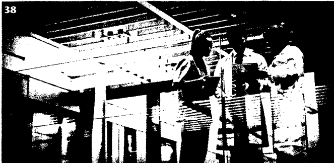
38 Die deutsche Krankenhauslandschaft ist von einer flächendeckenden Digitalisierung weit entfernt. Intergenerationelle Unterschiede sind dabei aber nur ein Hemmnis.