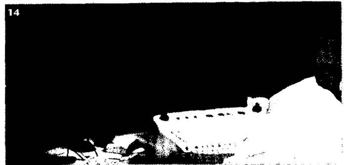
Die Digitalisierung verändert den Alltag in der Radiologie. MTA sind aufgefordert, sich dieser Entwicklung zu öffnen und sich weiterzuqualifizieren.