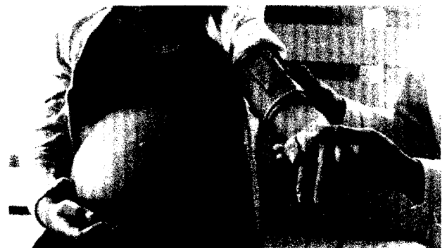
CME Hypertonie und Präeklampsie: Erhöhte Vorsicht bei Frauen nach Fertilitätstherapie INT J FERTIL STERIL 16