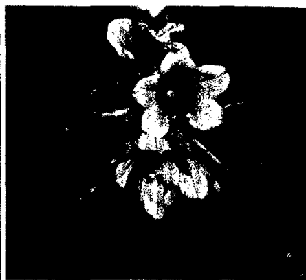
Unruhe und Verhaltensstörungen – Michaela Aschberger-Hedel