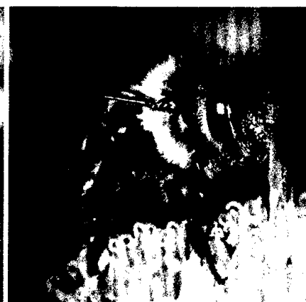
Minimal-Change-Glomerulonephritis – Uschi Lantenhammer