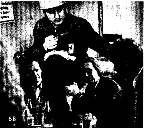
Beim Kickoff-Meeting in Frankfurt am Main ging es um die Features des neuen Dentsply Sirona Scanners „Primescan“.

Digitalisierung First: Der Megatrend der IDS 2019 .....S. 6 Anne Barfuß