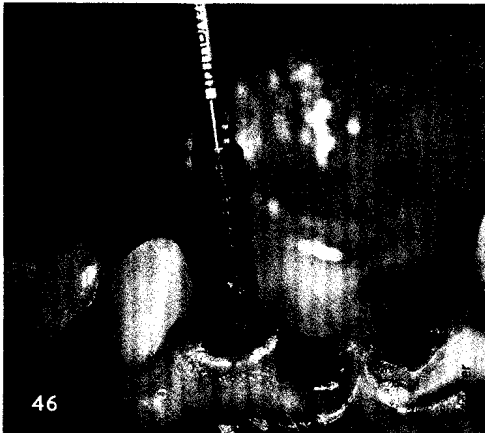
Trend Sofortimplantation: In Deutschland sind die Zahnärzte noch skeptisch. Ist diese Haltung gerechtfertigt?