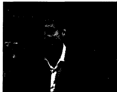
CAMILLO WIZ. MIT FRIEDL. GEN. VON ECKHART VON HIRSCHHAUSEN

Hirschhausens Hirnschmalz Glaube versetzt Berge – und verhindert Plaques 90