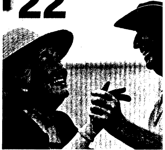
Analyse: Wie sich die Krankheitslast im Alter verändert hat