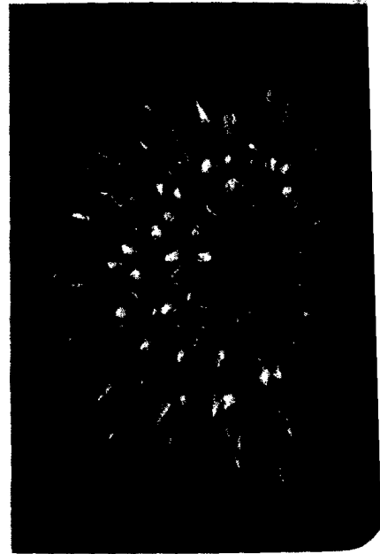
Titelfoto: Ananas bracteatus (Red Pineapple)