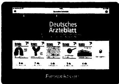
Tablet-App: Das Deutsche Ärzteblatt auf dem Tablet, für iOS sowie für Android. Zudem auch alle Supplements für Facharztgruppen, die Ausgabe für Medizinstudierende und das Deutsche Ärzteblatt für Psychotherapeuten PP. Mehr dazu unter www.aerzteblatt.de/tablet