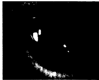
◀ Alternierende formstabile Kontaktlinsen: Rainer Bronner liefert eine Übersicht verschiedener Möglichkeiten in Konstruktion und Anwendung von formstabilen Kontaktlinsen zur Presbyopie-Korrektion.