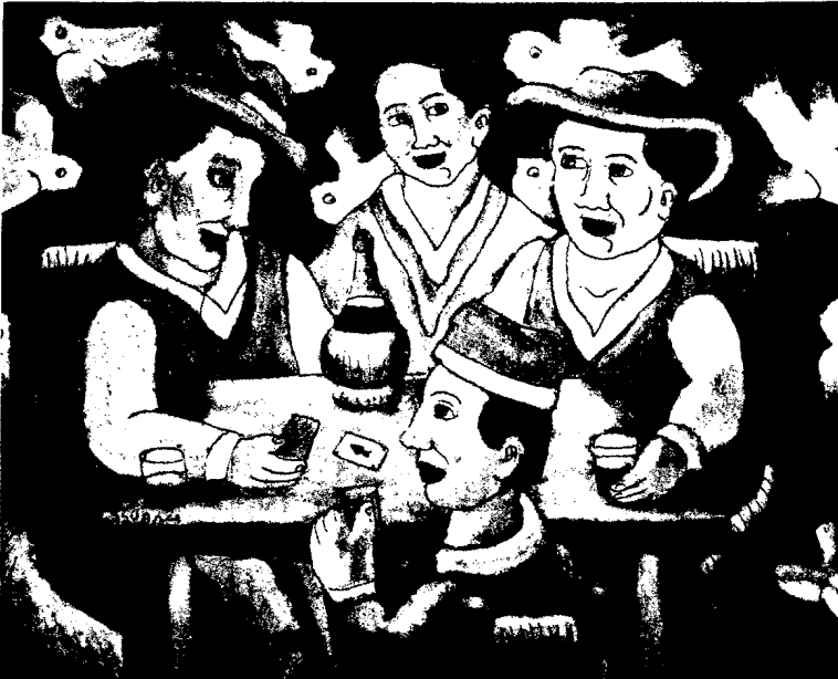
La partita a carte Roberto Sguanci, Ölbild auf Karton Nähreres zum Bild auf Seite 70.