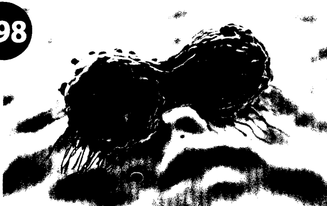
© Dividing Breast cancer cell - DTKU100 - Fotolia