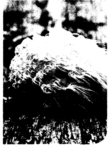
Igelstachelbart ( Hericium erinaceus )