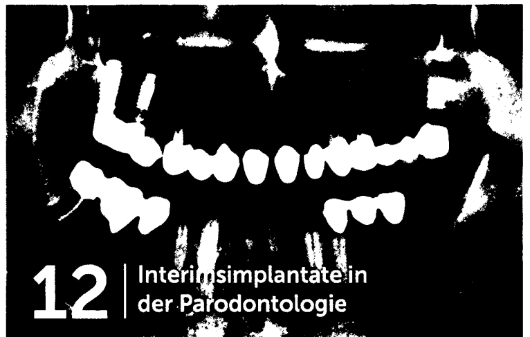
12 | Interimsimplantate in der Parodontologie