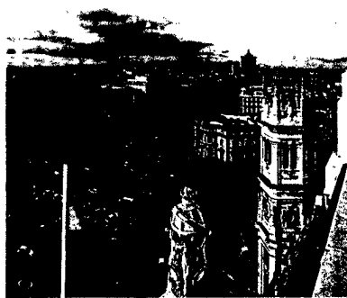
EHA-Kongress 2017 in Madrid