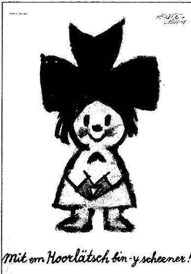
Herbert Leupin – Plakat, 1958