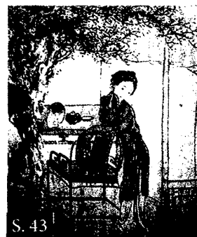
Andreas Noll Körpergottheiten (Teil 2)