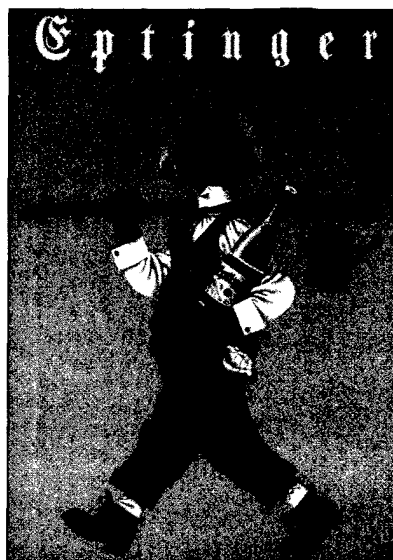
Herbert Leupin – Plakat, 1944