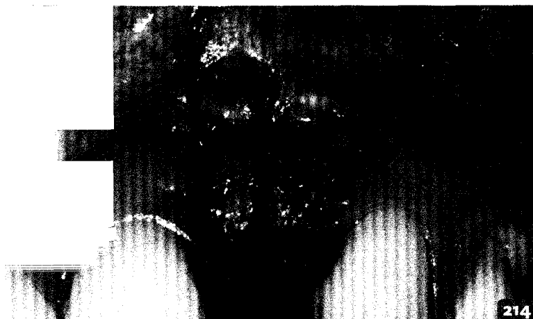
Wieviel Weichgewebe benötigt ein Implantat?