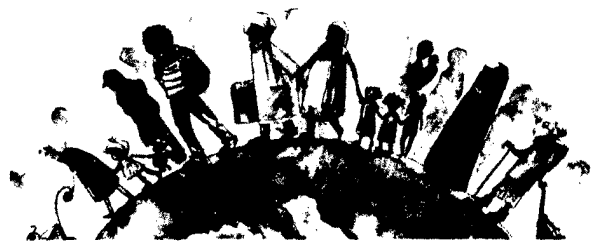
41 Alle aktuellen DFP-Veranstaltungen auf einen Blick